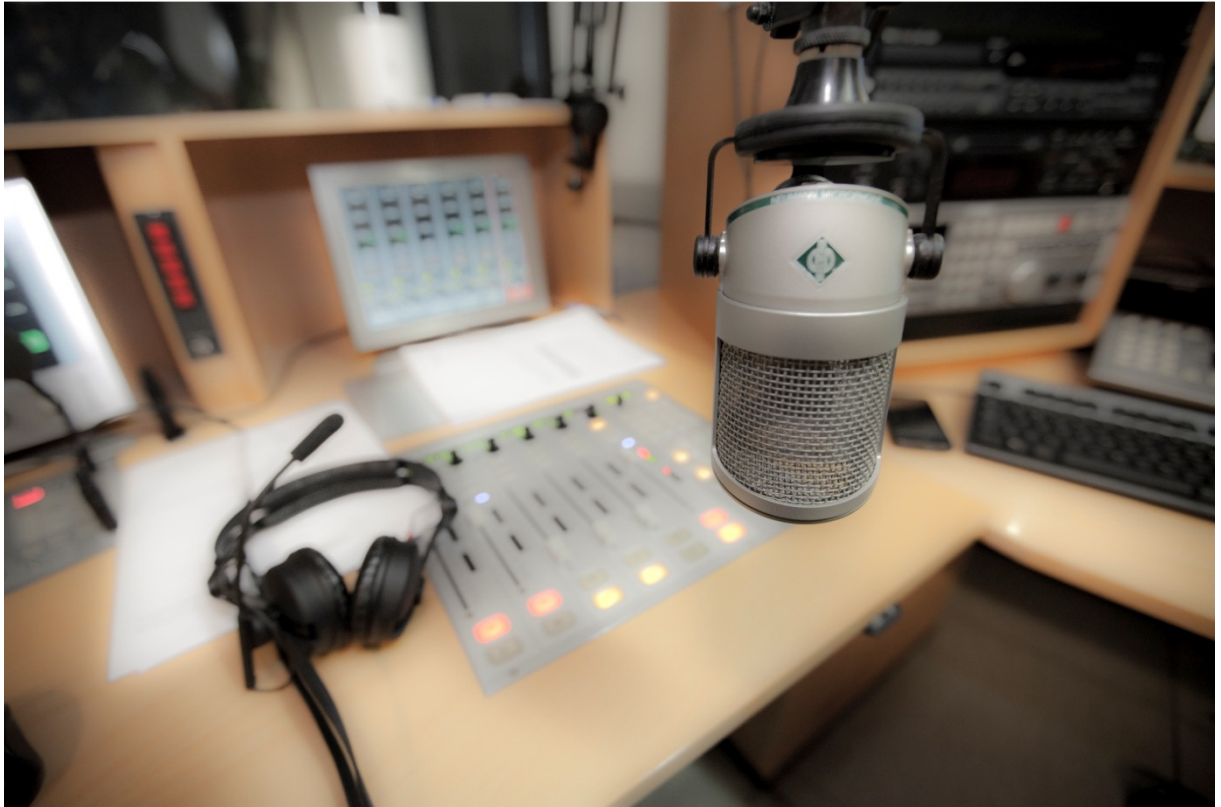
Teknikrummet ved det store radiostudie