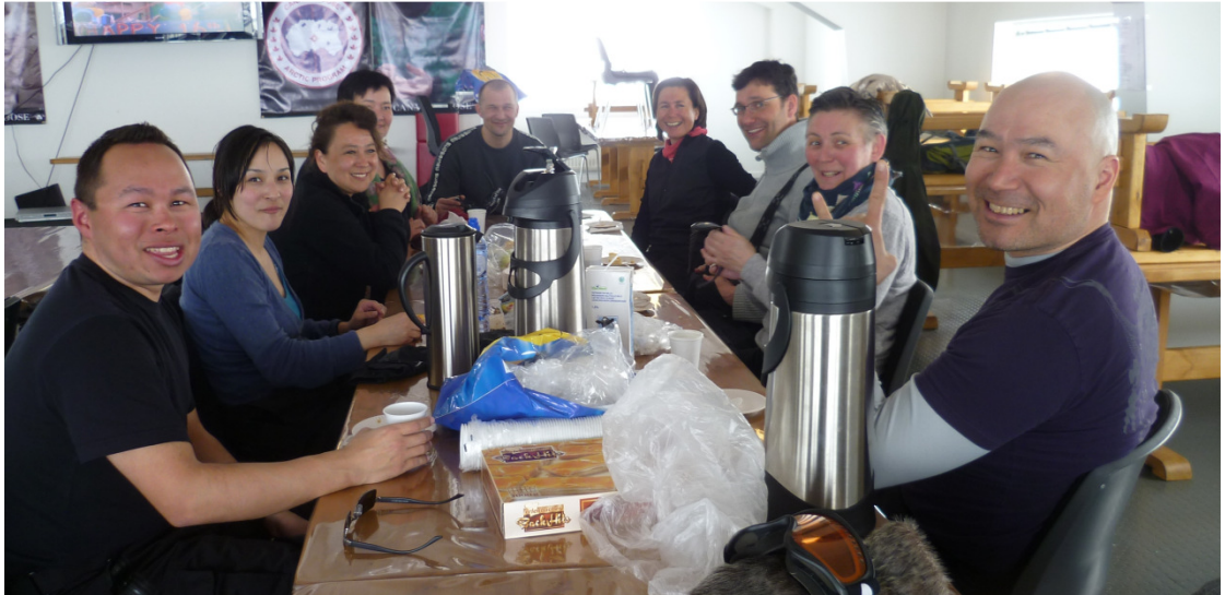
Trods den korte sæson nåede vi at holde en skidag på liften