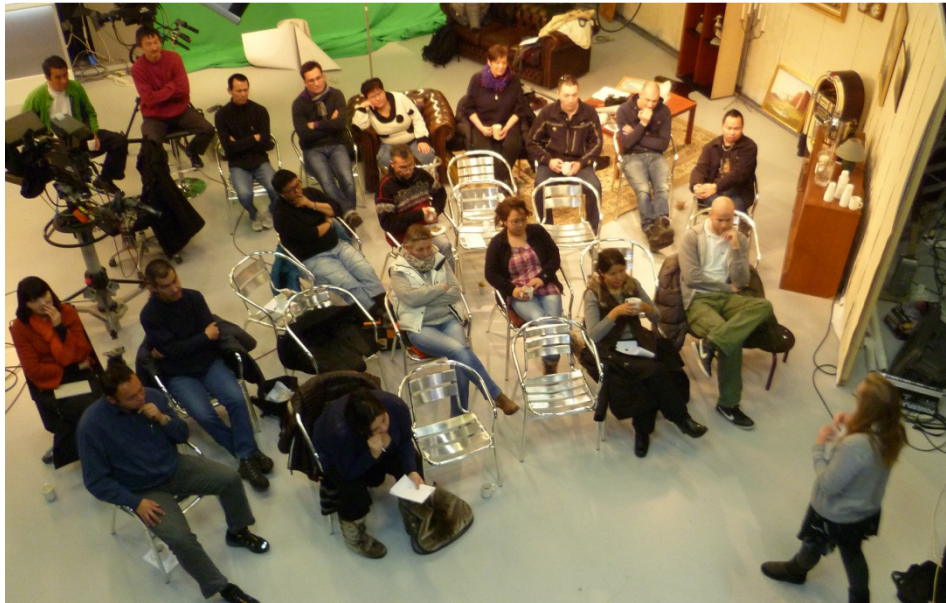
Kursus i journalistik i det store TV studie

KNR har i 2011 brugt 351.000 kr. på efter- og videreuddannelse, og dertil kommer en del kurser, der er afholdt med eksternt støtte. Følgende kurser har været gennemført, og langt de fleste blev holdt i Nuuk: